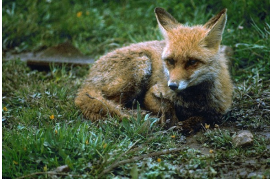
DEL MORRO FÍ