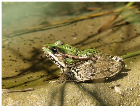
DEL CAP GROS