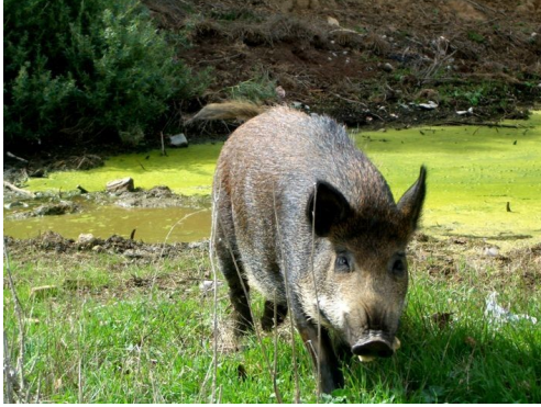
DELS ULLALS CORCATS